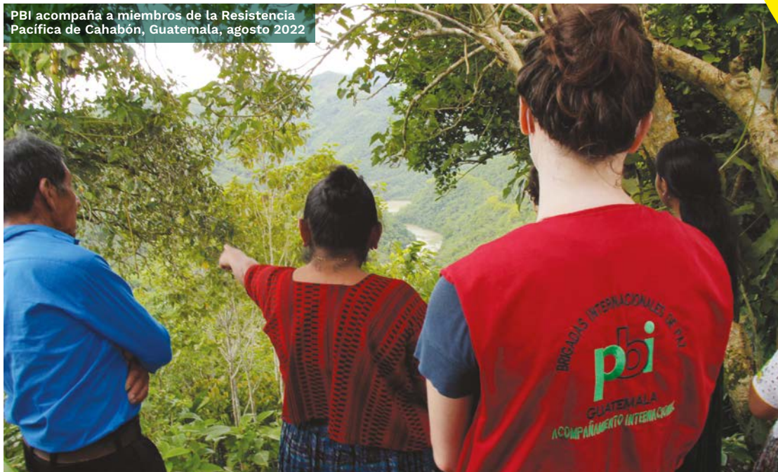
PBI acompaña a miembros de la Resistencia Pacífica de Cahabón, Guatemala, agosto 2022

“ El enfoque de PBI es sencillo y eficaz. Gracias a nuestro apoyo, las y los activistas, abogados, periodistas y otras personas defensoras pueden dedicarse a cambiar el mundo ”