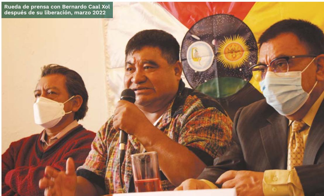
Rueda de prensa con Bernardo Caal Xol después de su liberación, marzo 2022