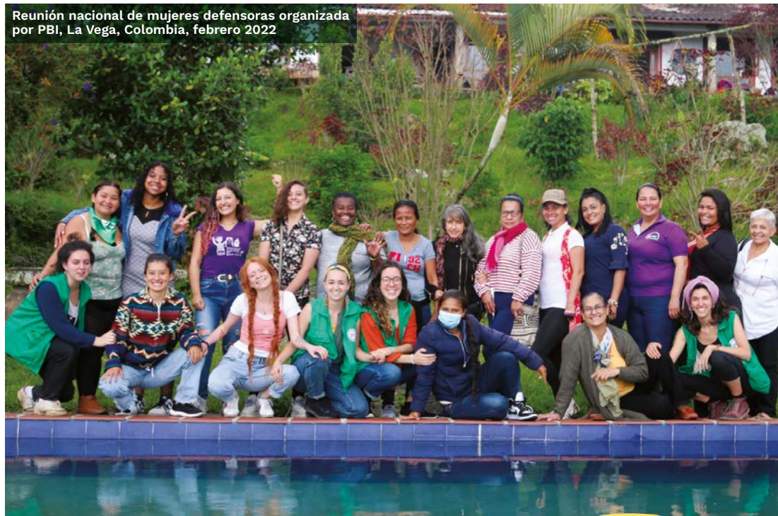
Reunión nacional de mujeres defensoras organizada por PBI, La Vega, Colombia, febrero 2022