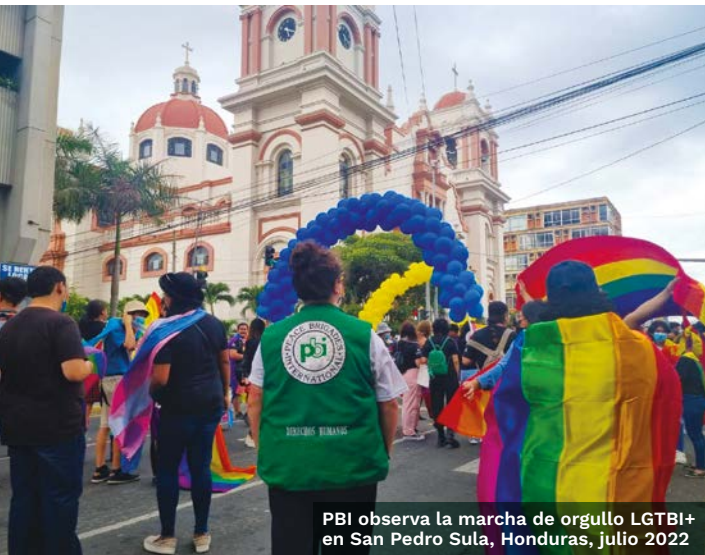
PBI observa la marcha de orgullo LGTBI+ en San Pedro Sula, Honduras, julio 2022