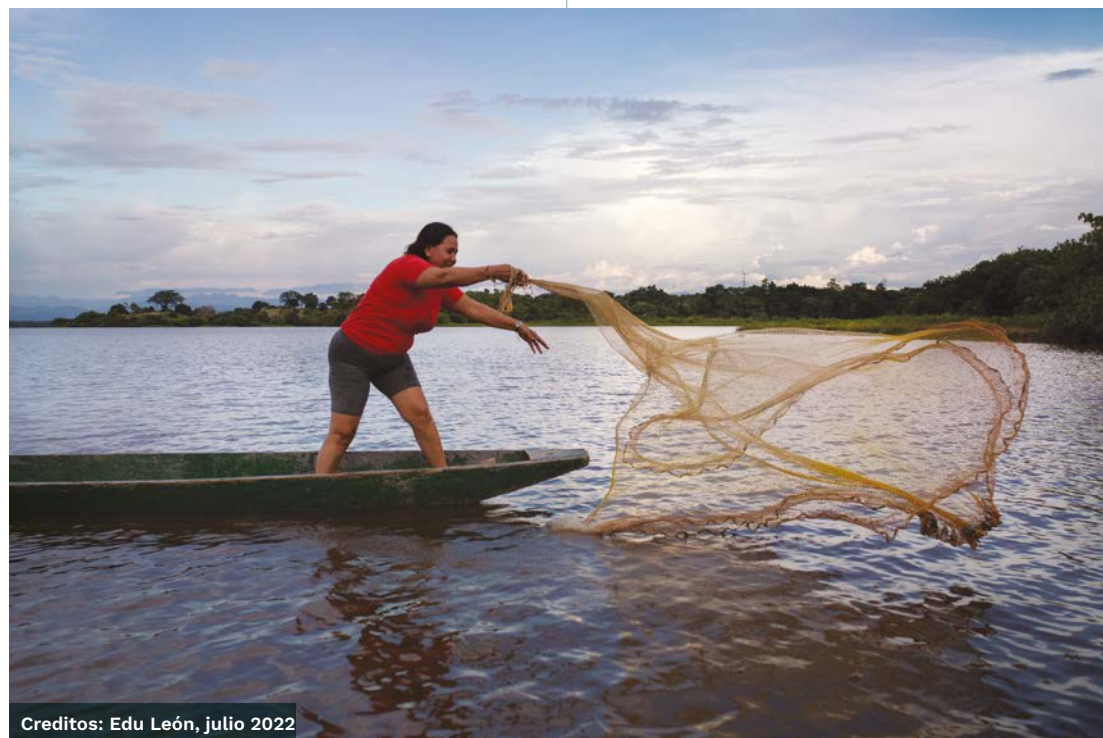
Creditos: Edu León, julio 2022

En la 51ª sesión del Consejo de Derechos Humanos de Naciones Unidas, PBI expresó su preocupación por la situación de Credhos y Fedepesán y habló con el Relator Especial sobre Agua y Saneamiento quien, durante su visita a Colombia, se reunió con ambas organizaciones y con PBI. Con estas acciones, PBI ha logrado reducir los riesgos para los defensores ambientales en el Magdalena Medio, a pesar de los atentados contra sus vidas y su dignidad.