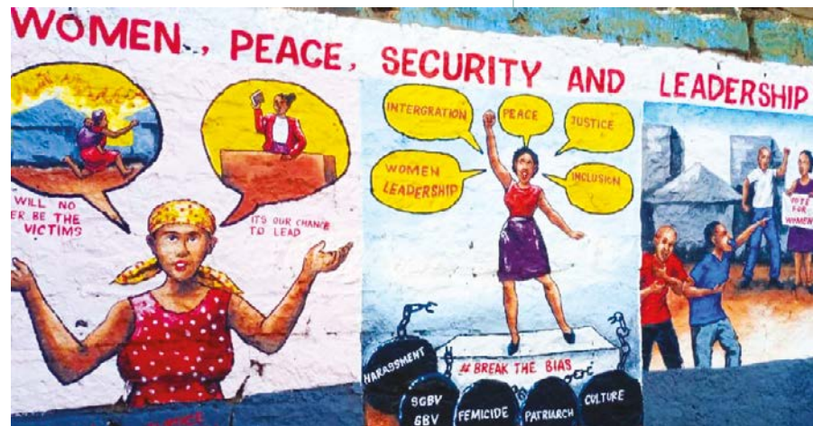
Mural sobre mujeres, paz y seguridad para el Día Internacional de Mujeres, hecho en Kibera con la comunidad de personas defensoras, Kenia, marzo 2022