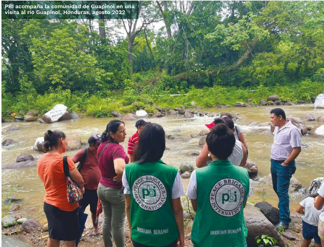
PBI acompaña a la comunidad de Guapinol en una visita al río Guapinol, Honduras, agosto 2022

de amenazas y hostigamiento hacia las personas defensoras. La empresa sigue operando en la zona a pesar de las múltiples denuncias presentadas por la comunidad. Ante esta situación, hemos reforzado nuestra presencia física en la comunidad y nuestro trabajo de incidencia nacional e internacional sobre el caso.