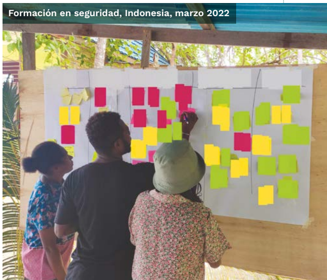
Formación en seguridad, Indonesia, marzo 2022