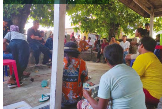
Foro comunitario sobre los derechos ambientales, Indonesia, junio 2022

PBI reconoce que la defensa efectiva de los derechos humanos tiene que empezar en casa, por lo que nos hemos unido a coaliciones para hacer frente al retroceso de los derechos en el Reino Unido, defendiendo la Ley de Derechos Humanos y oponiéndose a las restricciones del derecho a la protesta.