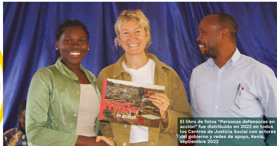
El libro de fotos “Personas defensoras en acción” fue distribuido en 2022 en todos los Centros de Justicia Social con actores del gobierno y redes de apoyo, Kenia, septiembre 2022